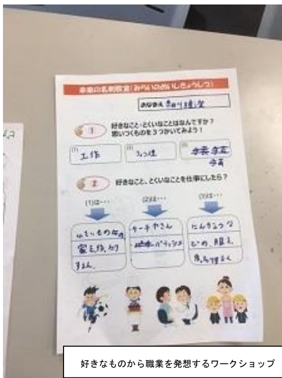
好きなものから職業を発想するワークショップ