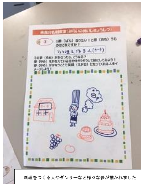
料理をつくる人やダンサーなど様々な夢が描かれました